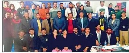
एसआईटी में हुई कार्यशाला में मौजूद निदेशक और प्रतिभागी।