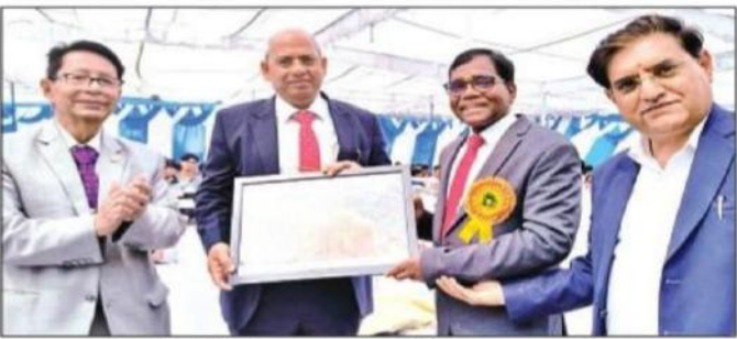
स्पेक्ट्रम कार्यक्रम में अतिथियों का स्वागत करते शिक्षक।