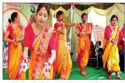
इंजीनियरिंग कॉलेज में सांस्कृतिक कार्यक्रम प्रस्तुत करती छात्राएं।

इस दौरान उन्होंने जीआईसी में संचालित एसआईटी और मड़धूरा इंजीनियरिंग कॉलेज का निरीक्षण किया। सोमवार को वीर माधो सिंह