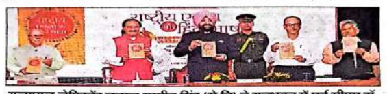
राज्यपाल लेफ्टिनेंट जनरल गुरमीत सिंह (से नि) ने राजभवन में पूर्व सीएम डॉ. रमेश पोखरियाल निशंक द्वारा लिखित पुस्तक का विमोचन किया।

देहरादून। पूर्व मुख्यमंत्री व पूर्व शिक्षा मंत्री डॉ. रमेश पोखरियाल निशंक की नई पुस्तक 'एकता और हिंदी' आने वाले समय में देश ही नहीं विदेशों में भी हिंदी के प्रचार-प्रसार को बढ़ावा देगी। राज्यपाल लेफ्टिनेंट जनरल गुरमीत सिंह (सेनि) ने मंगलवार को राजभवन में पुस्तक का विमोचन किया। राज्यपाल ने वीर माधो सिंह भंडारी उत्तराखण्ड तकनीकी विधि (यूटीयू) के उत्तराखण्ड यूनिवर्सिटी कनेक्ट डैशबोर्ड का भी लोकार्पण किया। यूटीयू ने पूर्व में यूनिवर्सिटी कनेक्ट मोबाइल एप विकसित किया था, जिसे अब डिस्कटॉप और मोबाइल एप दोनों के लिए अपडेट किया गया है। इस एप से पाठ्यक्रम, संकाय, प्रवेश, नामांकन, बजट, शिक्षक, कर्मचारी, छात्र, एमओयू, उपलब्धियां, प्रशिक्षण और प्लेसमेंट, प्रशिक्षण कार्यक्रम, बुनियादी सुविधाएं आदि के बारे में सभी जानकारीयें संग्रहीत की जाएंगी। राज्यपाल ने यूकॉस्ट की ओर