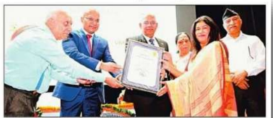
उत्तराखंड प्रौद्योगिकी विवि में शिक्षिका को सम्मानित करते अनिधि।