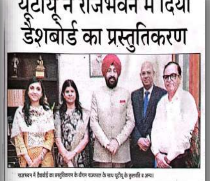
राजभवन में डैशबोर्ड का प्रस्तुतिकरण के दौरान राज्यपाल के साथ यूटीयू के कुलपति व अन्य