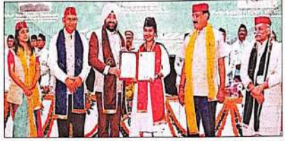
छात्रों को उपाधि व मेडल देते राज्यपाल लेफ्टिनेंट जेनरल गुरमीत सिंह (से नि.)। (कृपया ध्यान दें)

देहरादून। वीर माधो सिंह भंडारी उत्तराखंड प्रौद्योगिकी विश्वविद्यालय (यूटीयू) के दीक्षांत समारोह में 8197 छात्र-छात्राओं को डिग्री मिली तो उनके चेहरे खुशी से खिल उठे। इसमें 54 छात्र-छात्राओं को गोल्ड, 51 को सिल्वर मेडल और 59 को पीएचडी की उपाधि मिली।