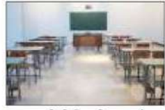
तकनीकी विश्वविद्यालय के वीसी का रुड़की के तीन कॉलेजों में औचक निरीक्षण

देहरादून, 11 अक्टूबर (ब्यूरो) : उत्तराखंड तकनीकी विश्वविद्यालय के कुलपति के औचक निरीक्षण में कई कक्षाएं लगभग खाली मिलीं। साथ ही छात्रों के उपस्थिति रजिस्टर भी कई जगह नहीं बनाए गए हैं। विश्वविद्यालय की तरफ से ऐसे कॉलेजों को व्यवस्थाएं सुधारने की चेतावनी दी है और साथ ही कहा है यदि स्थितियां नहीं सुधरीं तो कॉलेज के खिलाफ कार्यवाही की जाएगी।